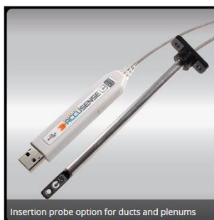
Insertion probe option for ducts and plenums

自動車のダクト、通気孔やオープンキャビンスペースに最大 36 ポイントで同時に多点気流の測定値を提供する為に、デグリーコントロールズは°C ポート 3600 を開発しました。一般的な羽根式風速計または手持ちプローブ風速計などの様な単一点測定装置は、空気流プロフィールに干渉する同時に、扱いにくく且つ一般にハンドヘルドセットアップから来る非反復性があります。°C ポート 3600 は、これらの制限を取り除き、アキュトラック™ と名付けた使いやすい Windows 互換のソフトウェアツールで気流・温度デー